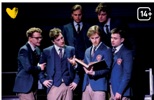
Stowarzyszenie Umarłych Poetów