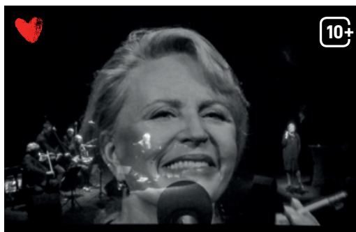
Zapiski z wygnania