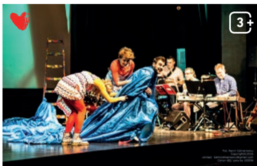
Nutki Pana Kleksa