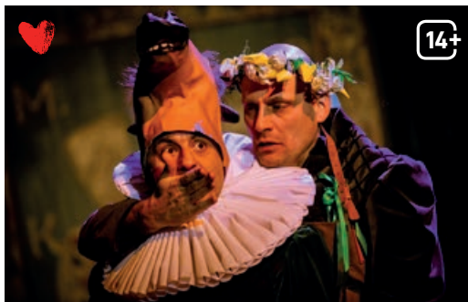
Dzieła wszystkie Szekspira (w nieco skróconej wersji)