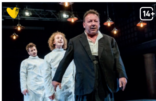
Dobry wojak Szwejk idzie na wojnę