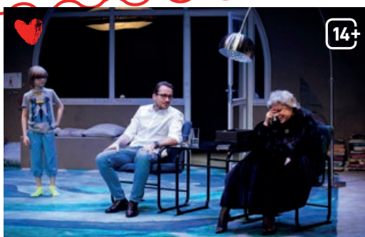
Matki i synowie