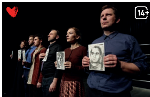
Żeby nie było śladów